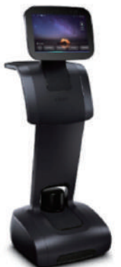
NTT docomo パーソナルロボット「temi(テミ)」

パーソナルロボット「temi(テミ)」を遠隔操作して、佐渡ヶ島を観光できる体験会を開催します。最新技術で佐渡の魅力をご紹介します。